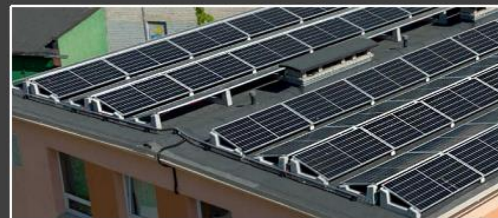
ESEMPIO INSTALLAZIONE SISTEMA EST-OVEST SU TETTO PIANO